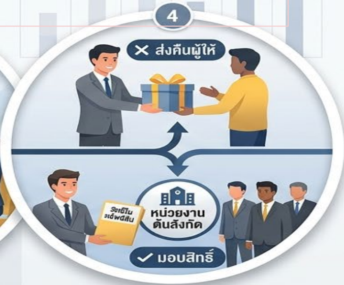
4. ส่งคืนผู้ให้ หรือ มอบสิทธิให้หน่วยงานต้นสังกัด

แจ้งข้อเท็จจริงหรือประโยชน์อื่นใดต่อหัวหน้าส่วนราชการ ผู้บริหารสูงสุดของรัฐวิสาหกิจ หรือผู้บริหารสูงสุดของหน่วยงานอื่นของรัฐ สถาบัน หรือองค์กรที่เจ้าหน้าที่ของรัฐผู้นั้นสังกัด