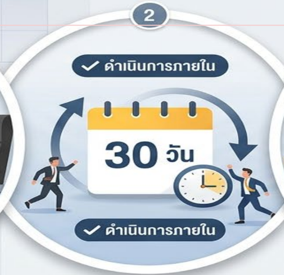
2. ดำเนินการภายใน 30 วันนับแต่วันที่ได้รับ