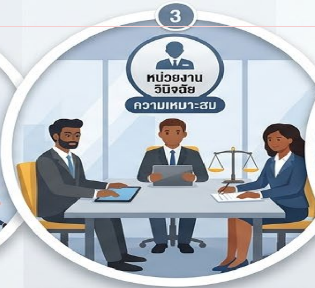
3. หน่วยงานวินิจฉัยความเหมาะสม