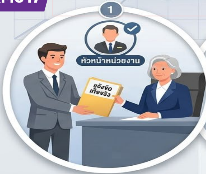
1. แจ้งข้อเท็จจริงหรือประโยชน์อื่นใดต่อหัวหน้าส่วนราชการ